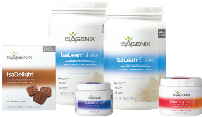
Paquete Estilo de Vida Saludable